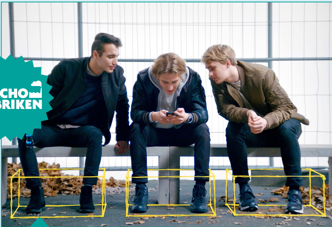
Bild från en av filmerna som ingår i Machofabriken's metodmaterial.

I andra skor är ett kortspel för ungdomar i åldrarna 16-25 år som används i skolan, på fritidsgården eller i idrottsföreningen.